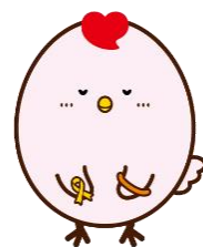
マスコットキャラクター こっけん