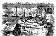
左から、自由遊びコーナー、出し物、せいさくコーナー