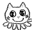
中村児童館キャラクター たこにゅん

リニューアル改修のため、名楽町に一時移転しています。場所等、ご確認をお願い致します。