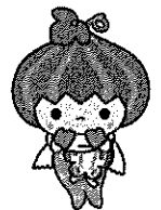
天白区マスコットキャラクター「かぼっち」

駐車場はありません。公共交通機関をご利用ください。 お子さまに、貴重品(現金・ゲーム機など高価なもの)を持ってこないよう、ご家庭でご指導をお願いいたします。 やむを得ず持ってきた場合は、事務所でお預かりすることができます。 万一、紛失や盗難等があった場合、児童館では責任を負いかねますので、ご了承ください。